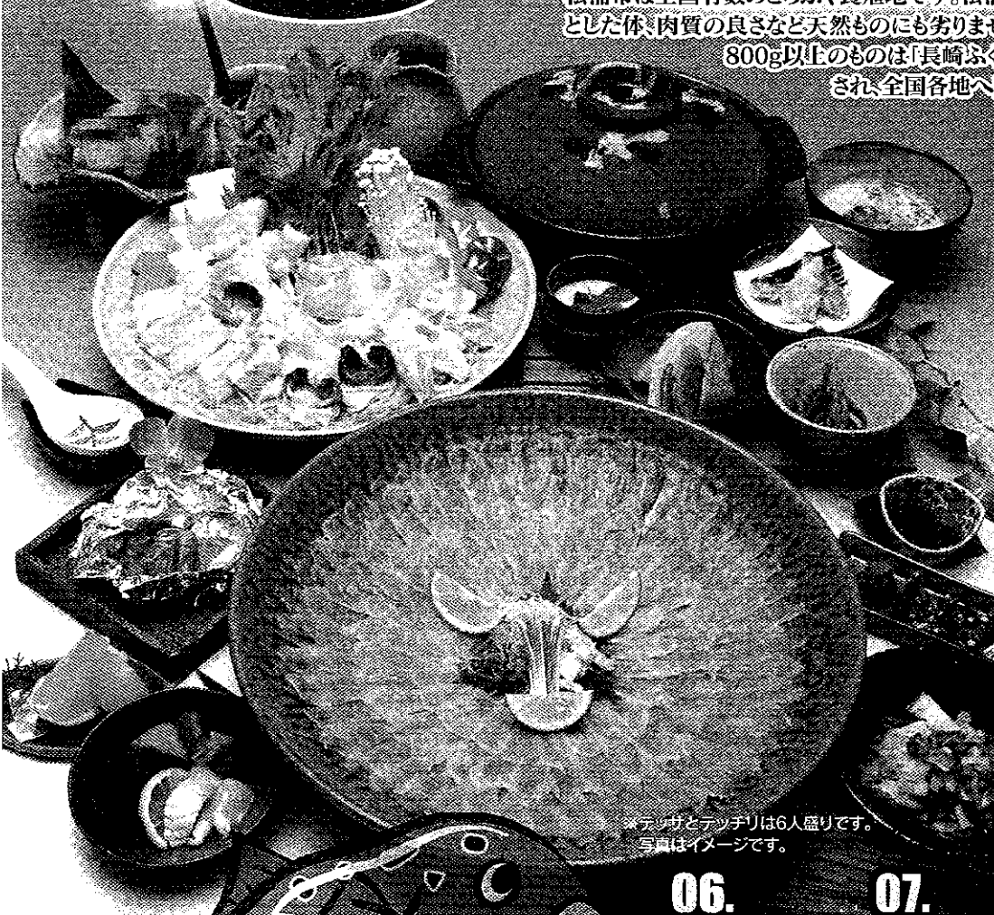
テッチリとテッチリは6人盛りです。写真はイメージです。